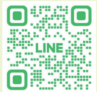
澎湖縣社區再造培力 中心LINE官方帳號