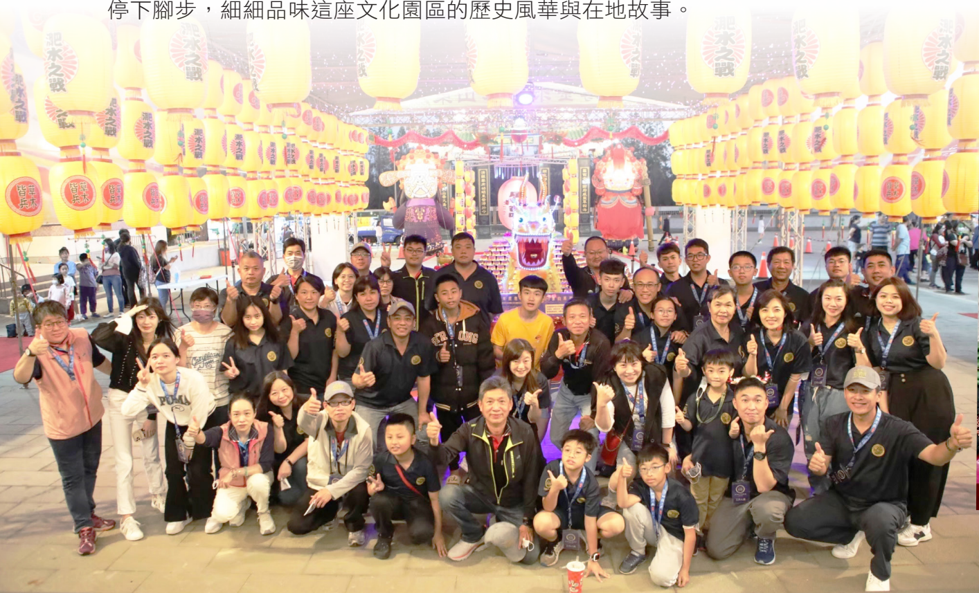
尖山社區年度元宵節活動 工作團隊合影留念

此外，尖山社區的文化資產也逐漸受到重視。顯濟殿舊廟於 106 年公告登錄為本縣歷史建築，依據《文化資產保存法》及《歷史建築輔助辦法》進行管理。該廟不僅具備歷史文化價值，更展現地域風貌與民間藝術特色，具有建築史與技術史的保存意義。未來，尖山社區將逐步規劃顯濟殿舊廟為「社區文化園區」，讓民眾不僅在元宵節期間參與熱鬧的節慶活動，也能在平日走進社區，停下腳步，細細品味這座文化園區的歷史風華與在地故事。