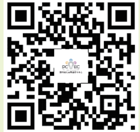
澎湖縣社區再造 培力中心