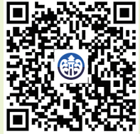
澎湖縣政府社會處