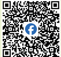
澎湖縣社區再造 培力中心粉絲頁