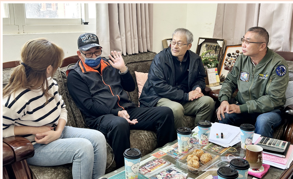
培力中心拜訪湖西社區新任理事長、總幹事

首先，沒有帶頭就不會有跟進：觀察台灣社區營造的現象，很明顯地，都需要有一個帶頭的人。這個帶頭的人，就好像一把粽子線頭端的結一樣，把一個個的粽子連起來，並且還能把大家提起來。社區工作的推動，也需要有一個帶頭的人，透過他把大家拉動起來。當然，這個人在社區組織裡，往往就是理事長這個角色。不過，因為理事長有任期的限制，因此如何能順利找到接續的人選，成為帶頭的人，是社區經營過程中的大事，也應該是平時就必須加以重視的事，否則到改選時找不到帶頭的人，後果可能不堪設想。