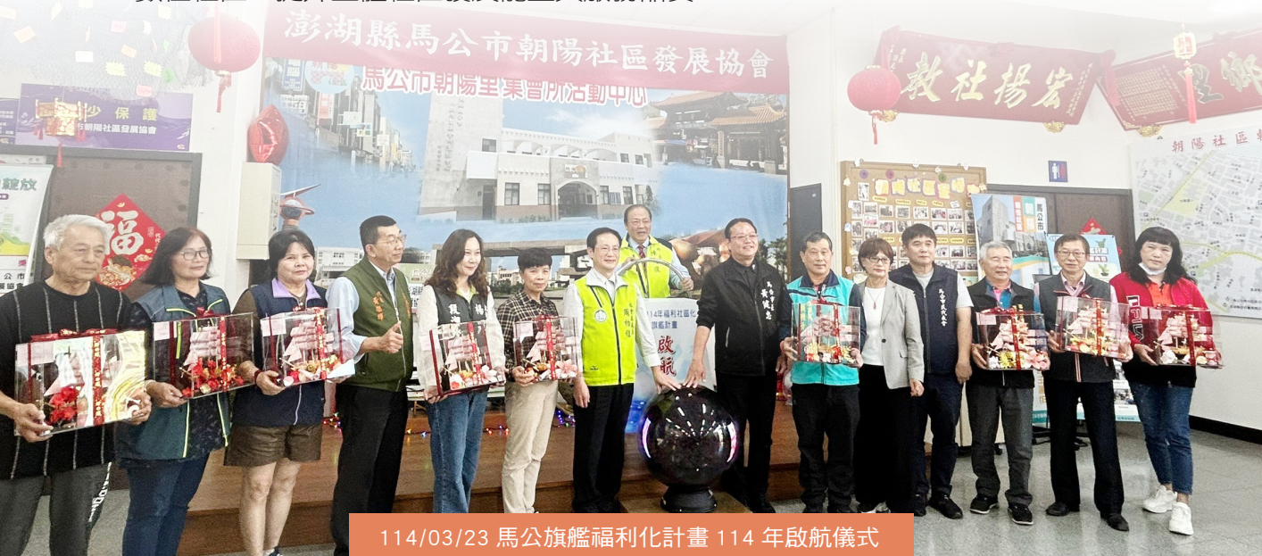
114/03/23 馬公旗艦福利化計畫 114 年啟航儀式

本團隊以澎湖縣政府縣政發展主軸為依循，扎根社區、落實「福利化社區」為核心方向，作為社區培力中心的經營理念與推動路徑；並從「專業協作、實務輔導、創新研發」三大面向出發，整合澎湖科技大學跨領域師資與在地資源，突破科層限制，強化社區直接服務的專業效能。中心將聚焦三項重點：其一，組織專業面向—結合社區資源培育社區人才，協助社區朝向永續與創新發展，並建置社區資料與人才資料庫，系統化傳承社區發展經驗；其二，延續連結與支持一對一曾接受輔導之社區與幹部持續陪伴，推動社區陪伴制度，導入大專生志工共同實踐大學社會責任，培植社區自主發展潛力；其三，服務數位創新一鼓勵社區工作微創新並以科學驗證檢討服務模式與績效，培育社區規劃、執行與資源聯結能力，透過標竿社區觀摩促進交流合作，同步建置澎湖縣社區培力資源網絡，逐步推進數位社區，提升整體社區發展能量與服務品質。