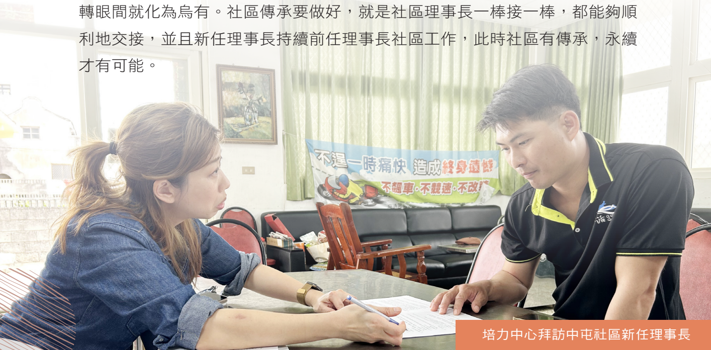
培力中心拜訪中屯社區新任理事長

最後，沒有傳承就不會有永續：永續是現今世界上最具有普遍性的共識，也被視為是最崇高的理想，當然我們經營社區，終極目標也是要達到社區永續。但是，永續不能只是一個口號，我們應該知道要如何才能永續。很顯然地，傳承應該是永續的基礎，也是先決條件。如果沒有傳承，現在所有的一切，可能轉眼間就化為烏有。社區傳承要做好，就是社區理事長一棒接一棒，都能夠順利地交接，並且新任理事長持續前任理事長社區工作，此時社區有傳承，永續才有可能。