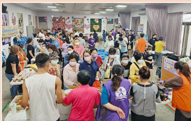
西衛社區異國童玩節活動

西衛社區『異國童玩節』活動讓人印象深刻，當天有ㄉ×ㄌㄨ煙前、印尼童玩、異國美食等，有新住民家庭和社區居民共融共樂，熱鬧滾滾，當天有印尼播棋 (Congklak)(播棋：一種具有悠久歷史的遊戲，用木製棋盤和貝殼 (或種子、石頭) 玩，可以培養智力和戰略思維) 和越南美食 - 涼糕、台灣古早味的ㄉ×ㄌㄨ煙前ㄣYㄨㄣ×冰及台灣童玩踢毽子等，展現文化交融的魅力，這場活動不僅僅是一場童玩節活動，它更是一場文化交流的盛會，也讓社區居民與新住民能夠在輕鬆愉快的氛圍中建立更深的連結。