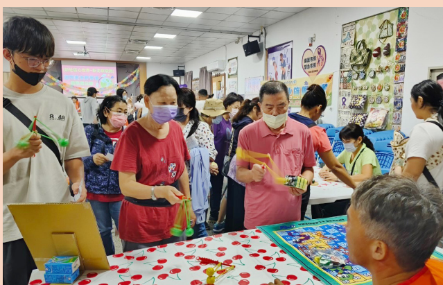
民眾攤位參與活動的體驗異國文化的特色