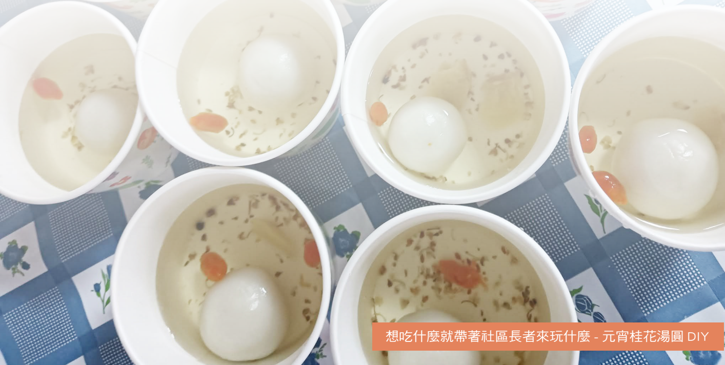
想吃什麼就帶著社區長者來玩什麼 - 元宵桂花湯圓 DIY

關懷據點的主要目標是提升社區長輩的生活品質，促進長者社會參與，並建立社區照顧網絡，讓長輩在熟悉環境中安享晚年，在地人照顧在地人的服務，也鼓勵社區居民一起參與志願服務，共同營造互助互愛的社區環境。