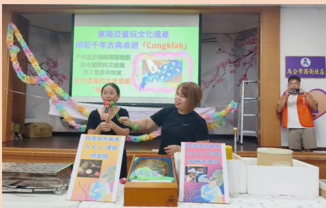
由新住民協會姐妹分享異國童玩及美食的特色