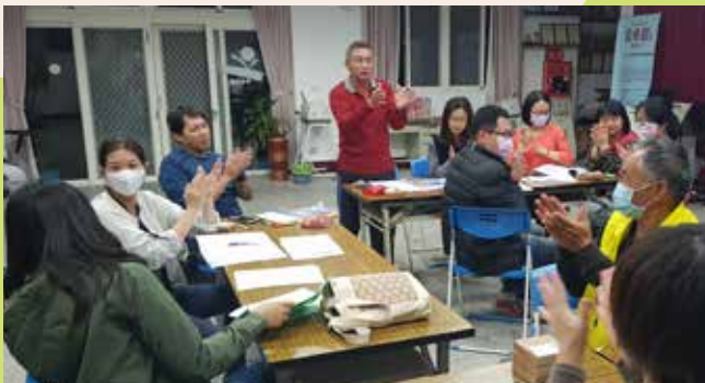
澎湖縣社區再造培力中心輔導團隊協力澎湖湖西社區，執行福利化社區旗艦計畫