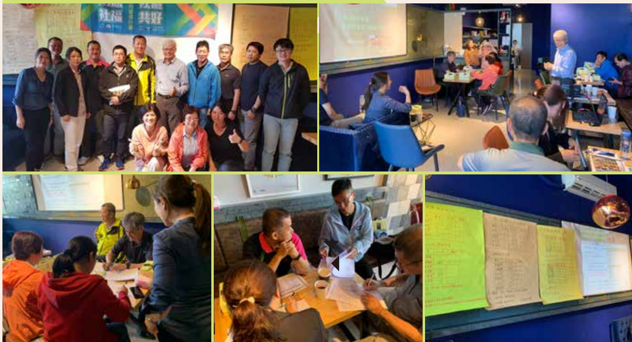
邀請本縣鄉(市)公所社區主管及承辦員參與一日社區工作發展專業訓練