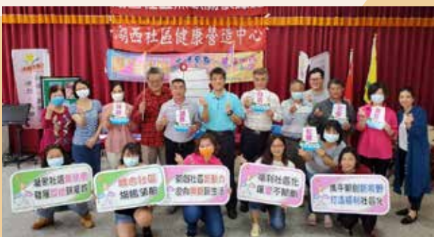
109/4/18湖西社區啟動澎湖縣辦理「109年社區福利化社區旗艦計畫」—深耕社區：樂活菊島，幸福湖西