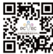
澎湖縣社區再造培力中心 粉絲頁