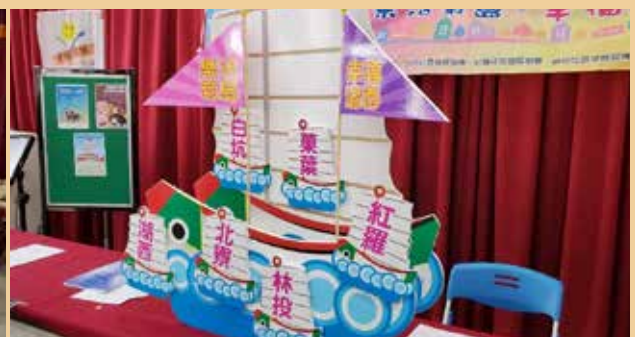
聯合湖西、菓葉、北寮、白坑、紅羅、林投社區，讓社區提升社區福利化推動與發展能量