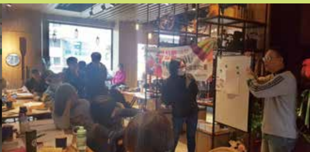
社區自主發想，設計出專屬社區LOGO