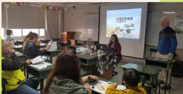
行銷自我社區LOGO課程