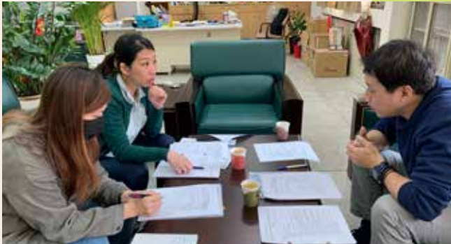
社區再造培力中心團隊與澎湖縣政府共同討論社區福利化工作等事宜