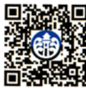
澎湖縣政府粉絲頁