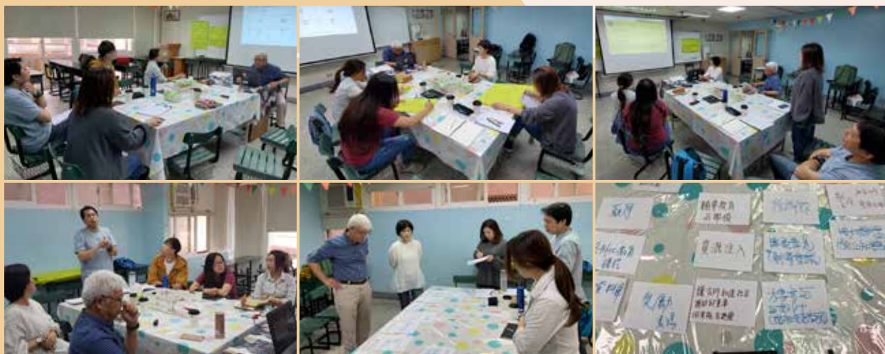
專業人員(外聘督導)訓練計畫，社會工作者透過內部在職訓練，學習社區輔導工作方法