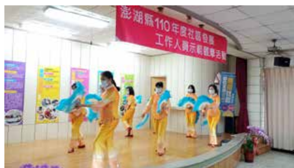
馬公市東衛社區 土風舞隊揭幕表演