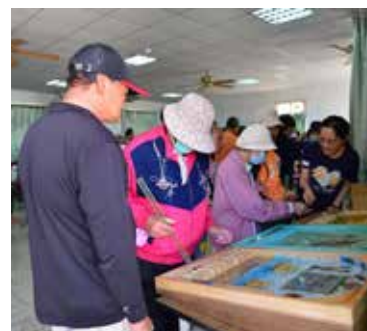
▲東安社區穩定成長，轉而推展長期性的社區照顧服務