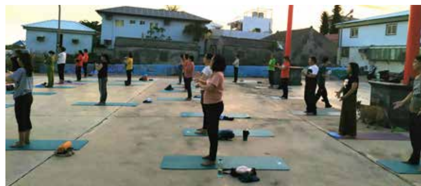
◀東安社區，藉由辦理體適能活動，凝聚社區服務能量