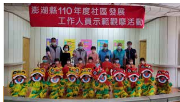
澎湖縣長為首 與各級長官熱烈參與