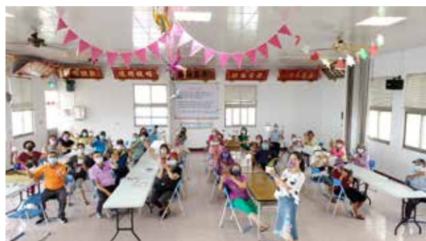
110/07/31 菓葉社區 辦理園藝治療