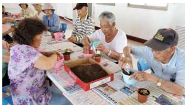
110/05/09 菓葉社區 辦理園藝治療