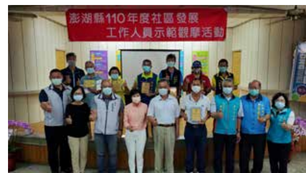
澎湖縣社區成長教室 活動績優社區表揚