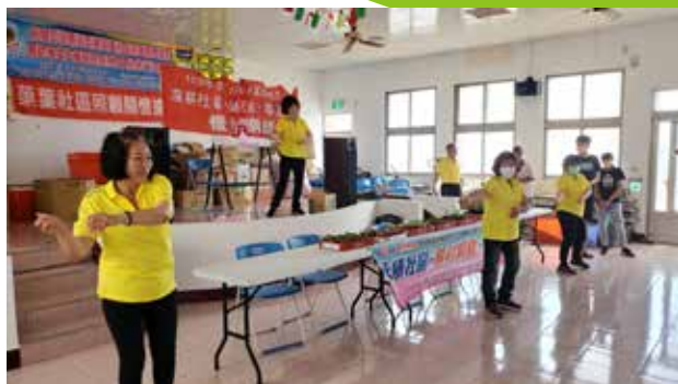
110/05/09 菓葉社區 辦理老人健康操活動