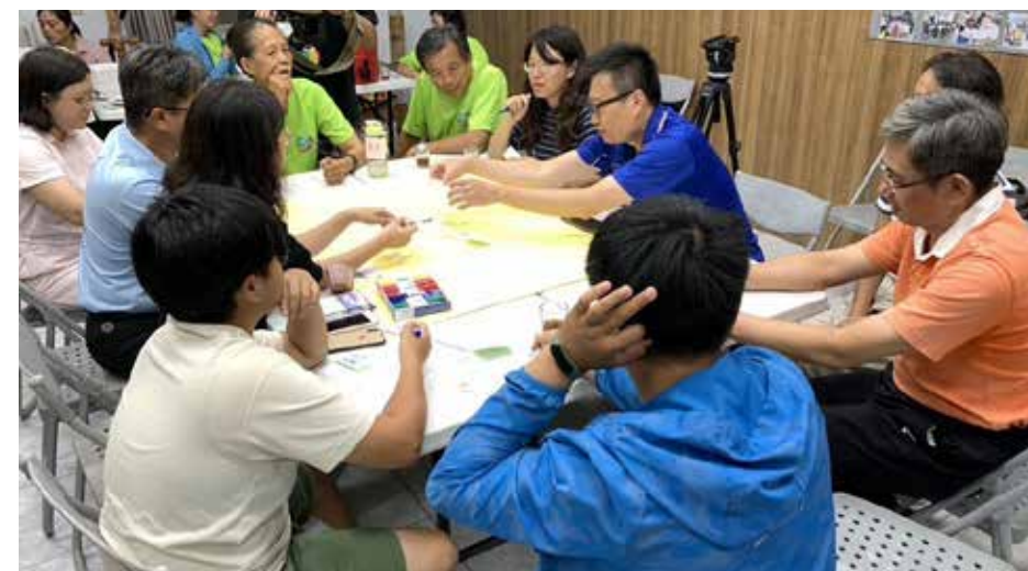
澎湖縣社區營造中心採用審議精神，由下而上蒐集民眾在地議題的意見

總結來說，政策決策過程已從過往代議制度，轉而採取審議溝通討論，審議概念也在文化部社區營造工作上備受重視，民眾由下而上的參與發聲，提供想法與建議，讓政府在制定政策上更能貼近民意，也更加完善。