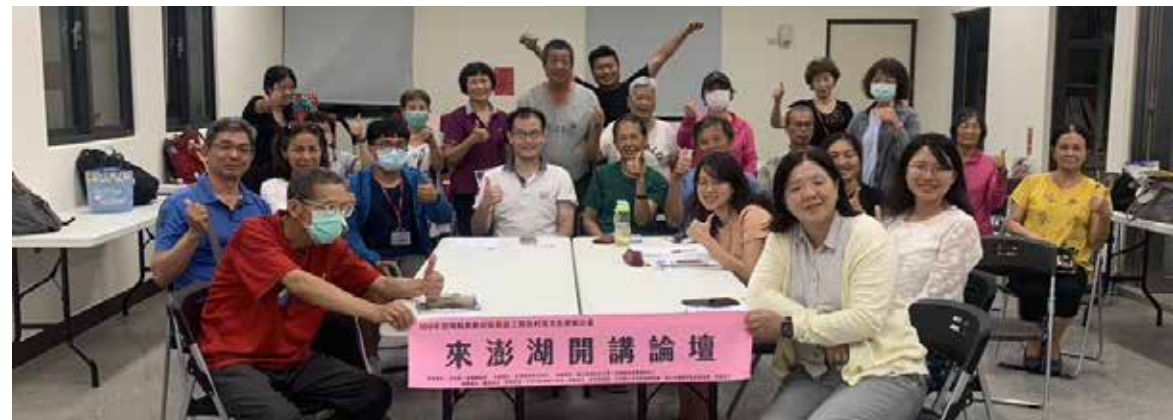
「來澎湖開講」論壇，培力公民參與文化事務及政策能力

然而，在著力社區服務的過程裡，他期盼社區成員能在祥和氛圍中合作，並建議理事長殷切邀請里長加入，成為夥伴關係。因此，在公私協力的聚合之下，決定從關懷社區長者為出發，申請成立社區關懷據點，提供共餐服務，促進長者認同社區，激勵招募成為志工，體現活躍老化的精神。同時，為激發社區青壯年族群參與社區服務，相繼規劃成立社區巡守隊、水環境巡守隊。前者以防災、防竊為