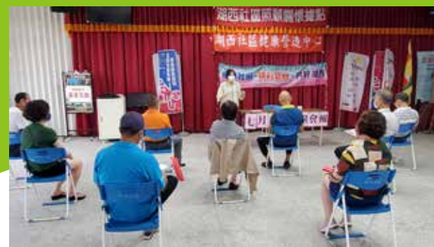
110/06/28 北寮社區 辦理7月份聯繫會報