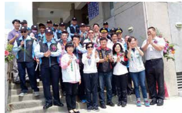
▲成立嵵裡社區巡守隊激發青壯年族群參與社區服務

主要目標，輔以加強社區老人服務；後者，於每月一天的環境志工日，共同維護社區環境清潔、嵵裡沙灘淨灘為任務。透過多樣的社區服務相互連結，形塑嵵裡社區世代共好，實踐「和諧」、「幸福」的願景。