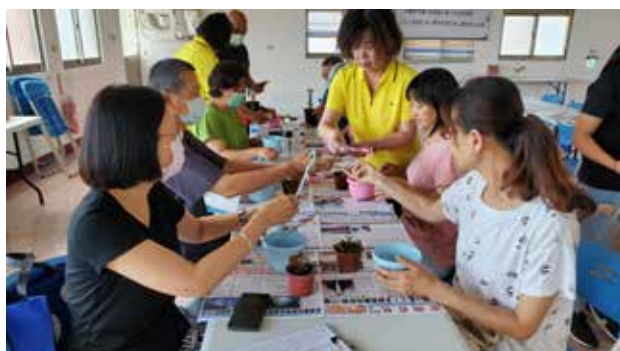
110/05/09 菓葉社區 辦理園藝治療