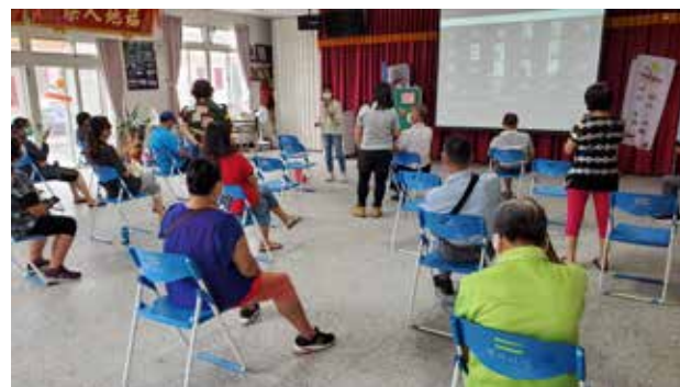
110/05/09 北寮社區 如何引導志工人員使用會議系統