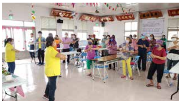
110/07/31 菓葉社區 辦理老人健康操活動