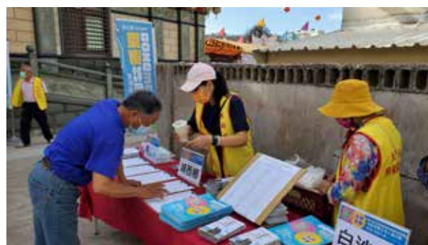
馬公市東衛社區 志工團隊熱情接待