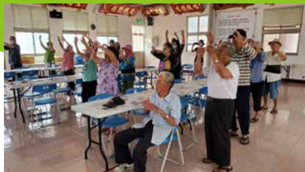
110/05/09 菓葉社區 辦理老人健康操活動