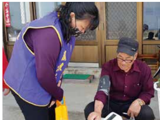
▲嵵裡社區志工服務團隊關懷嵵裡社區長者

澎湖縣文化局與國立澎湖科技大學（澎湖縣社區營造中心），期待透過審議精神的論壇討論，蒐集民眾對於不同議題的社區營造策略，達到以下幾點效益：其一透過論壇主題設定的多元性，由下而上廣泛探討現況問題及改進方向，蒐集對議題的不同意見，並思考各個議題在社區的發展策