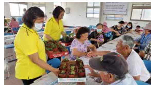
▲社區領袖幹部，得確定服務需求，再妥善安排志工進行服務推展

首先，釐清志工伙伴運用的目的是什麼內容？提供什麼樣的服務內容？確定需求後才能夠妥善安排志工服務工作。畢竟，志工服務過程，並無領取薪資報酬，都是憑藉願意利用閒暇之餘，付出心力來到社區提供服務。因此，在志工運用與管理過程，社區領袖幹部得展現傾聽技術，了解他們的想法與意向，熟悉每位個性、專長及興趣、感受情緒，建立良好的互動關係，有助於志工的管理與服務穩定延續。