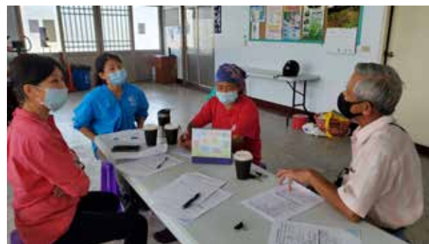
西嶼鄉 橫礁、竹灣、池西 夥伴社區合作輔導