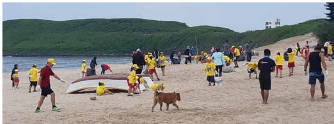
▲嵵裡社區每月環境志工日，社區世代共好實踐「和諧」、「幸福」願景

最後，他勉勵大家，從事社區服務工作中，卸下自我的社會身分，更能回歸服務本質，成為不退轉「無我」的「社區志願服務工作者」！