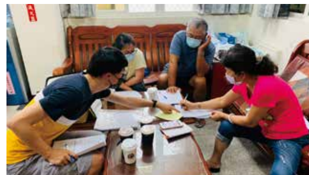
白沙鄉 赤坎、歧頭 夥伴社區合作輔導