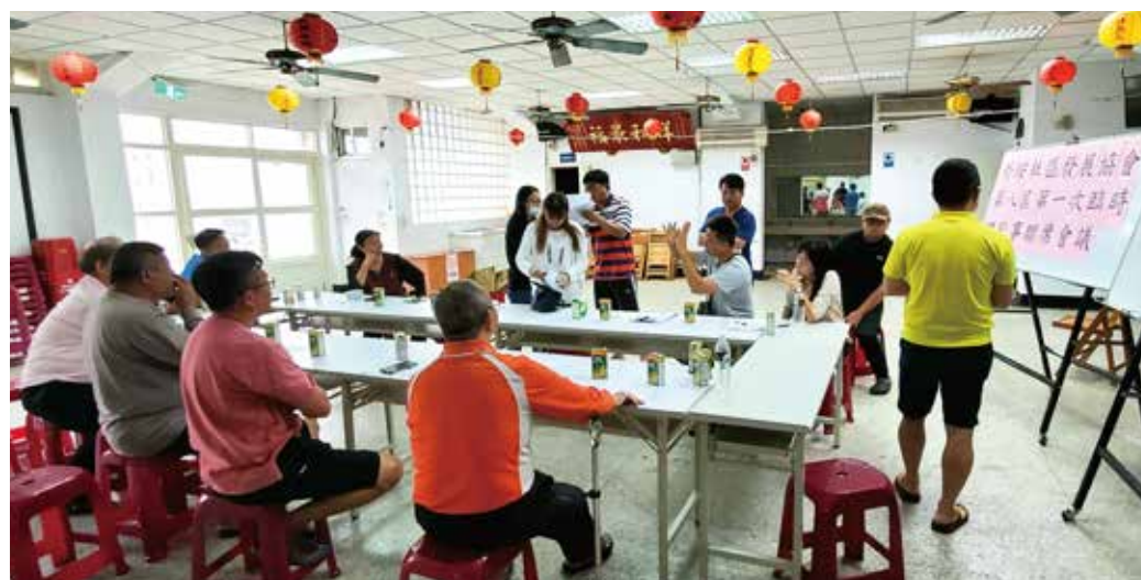
「人和」的確是社造工作的基本條件，若沒有人和，就不可能推動社區營造

很 多研究指出，社區若沒有人和，就不可能推動社區營造。在社造現場上，我們確實也看到了這種現象，因此人和的確是社造工作的基本條件。那麼，如果您是社區發展協會的理事長，無論面對社區裡的其他意見領袖，如村里長或宮廟主委，還是社區裡的民眾們，您要如何做，才能營造一個和諧的社區環境呢？也許以下幾點淺見，可供大家參考看看。