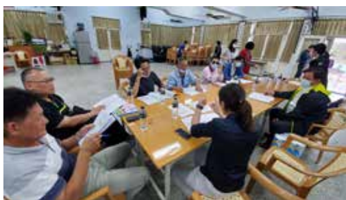
110/04/27 望安鄉 東安、西安、水垵、中社社區輔導媒合