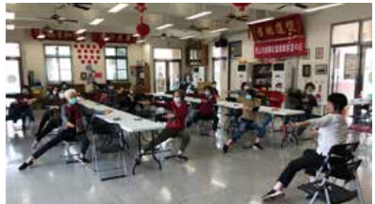
▲帶領馬公市朝陽社區音樂照護課程

台中時，都是帶著滿滿的幸福回到我們的工作崗位，也越發認真地做好自己崗位該做的事。我們非常感謝社區志工願意學習與願意助人，讓我們也有機會向他們學習，一起共成長與相互學習共善的連結。