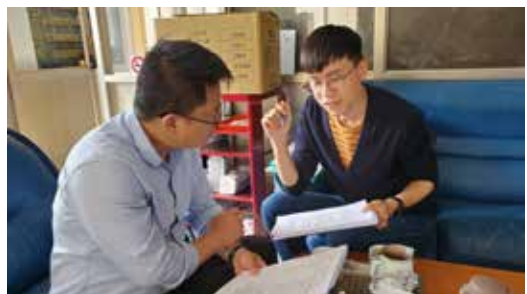
110/04/19 馬公市 東衛社區申請計畫輔導