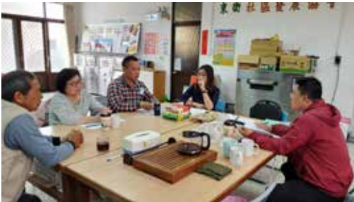
110/04/10 馬公市 東衛、前寮、興仁社區輔導媒合