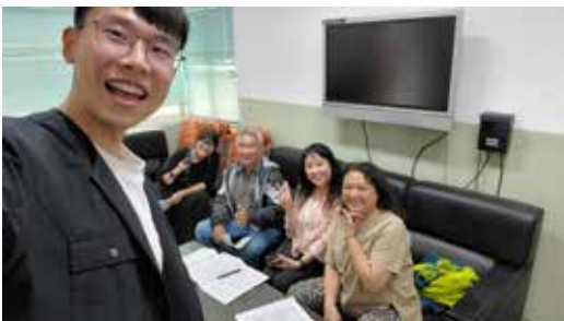
110/04/16 馬公市 案山、西衛、鎖港社區輔導媒合