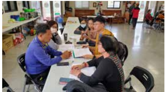
110/04/14 馬公市 朝陽、光榮社區輔導媒合