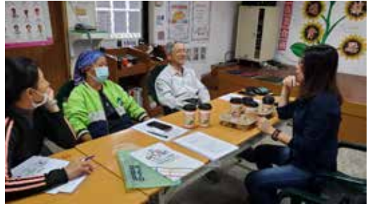
110/04/10 西嶼鄉 橫礁、竹灣、池西社區輔導媒合