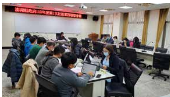
110/04/09 110年第一次跨局處會議