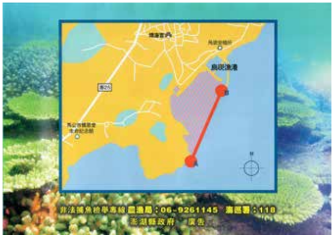
▲烏坎社區自主成立澎湖縣首支漁業資源巡守隊，於烏坎海域成立禁漁區

生態環境保育烏坎社區不遺餘力，為求海膽及海洋生物資源永續，於105年間提出社區自主性管理，並制訂公約，集結20名社區志願服務者，自行組成澎湖縣第一支漁業資源巡守隊，主動向縣政府申請獲准於烏坎海域成立禁漁區。透過「保育」、「復育」海洋資源，為社區「培育」人才，發展生態保育觀光，創建年輕族群留在社區工作機會，帶領遊客體驗海洋生態，營造在地特色產業，更寄望帶動澎湖海洋生態保育風氣。