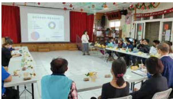
110/03/29 馬公市鎖港社區 台灣夢兒少社區陪伴扎根計畫續案審查