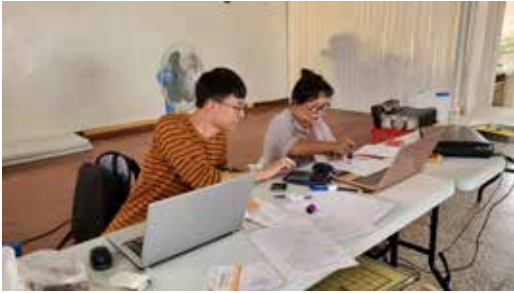
110/03/30 馬公市 五德社區申請計畫輔導