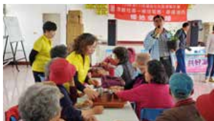
110/03/13 菓葉社區 辦理園藝治療