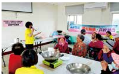
110/03/20 菓葉社區 辦理記憶中的菜餚