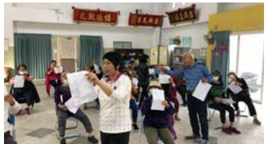
▲馬公市案山社區長者一同參與音樂照護課程