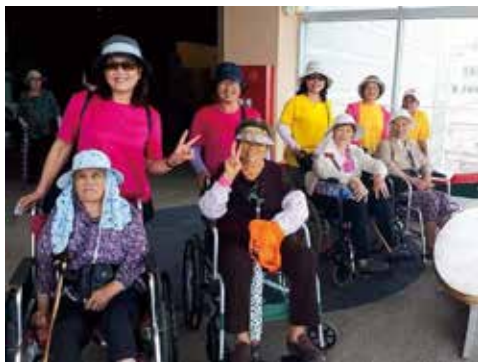
▲烏坎社區 推展社區長者健康促進活動

「有效運用資源，建立自主運作且永續經營的社區營造模式」。理事長表示近年運用烏坎生產又大又清脆的高麗菜資源，社區一群志工，發揮長才，齊心研發製作高麗菜酸包子、高麗菜水餃，得到熱烈迴響，不僅如此自辦高麗菜王競賽，吸引澎湖各地菜農一同較勁，亦成為社區年度盛事；還連結外部體育運動發展協會資源，辦理路跑賽事，期待串聯社區產業，促進地方經濟發展，增加社區的能見度。在未來，將與辛勤的志工們，持續服務，形塑烏坎社區是一個友善、有愛、有溫度的地方。