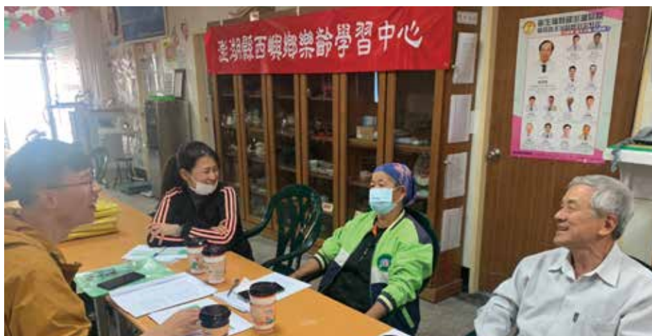
讓社區領袖有傳承及培養，發掘更多社區人才的參與

最後，傳承與培養新人接棒非常非常重要！其實，在此與理事長們相勉勵，並不是要您們一直做下去，做到累趴，大家都不能走人。人生是有階段性的，凡事也不是非我不可，更重要的是，社區工作需要更多的人來參與，如果今天您一直做，做到變成一個不可替代的領袖，那也不是一件好事。因此，我希望大家從現在開始，就開始培養接棒的人，讓社區領袖有傳承，同時發掘更多社區人才的參與，這樣您真的就可以不必那麼累了！