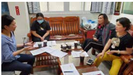
110/04/20 白沙鄉 赤崁、中屯、後寮社區輔導媒合