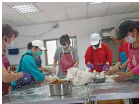
▲烏坎社區志工群， 齊心研發製作高麗菜酸包子