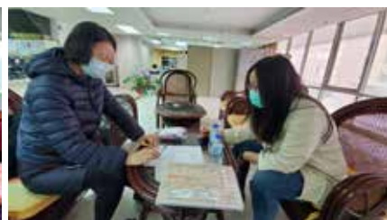
110/03/25 福利社區化旗艦型計畫輔導