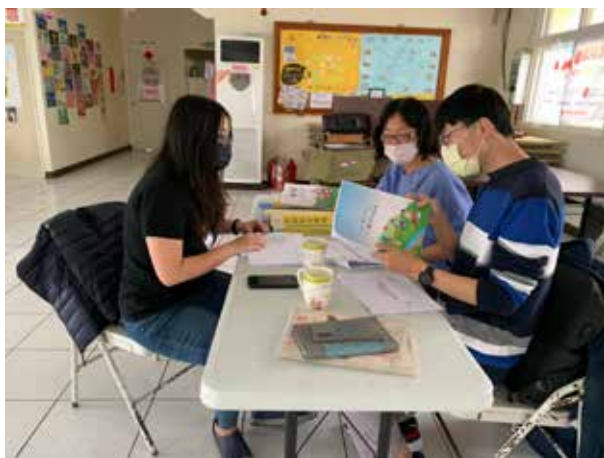
110/02/25 馬公市鎖港社區 台灣夢兒少社區陪伴扎根計畫輔導