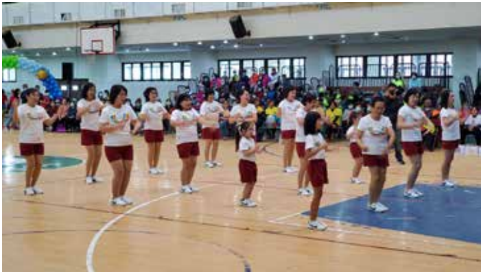
◀ 馬公市五德社區舞蹈表演