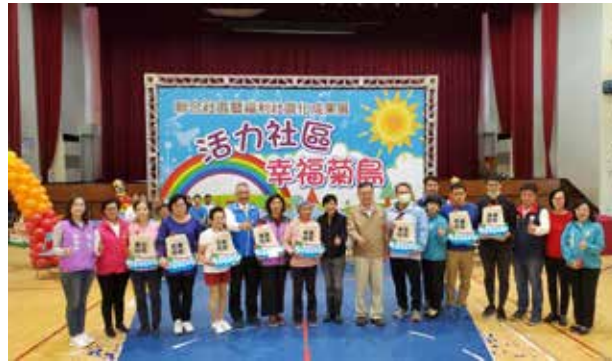
▲ 109年參與聯合社區計畫 擔任領航社區頒獎