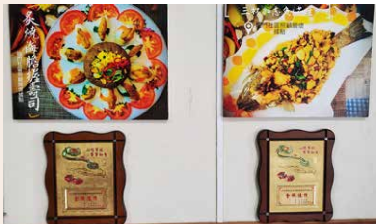
圖/龍門社區志工們共同設計社區特色餐食獲佳績

最後，鼓勵各位讀者們，若時間及體力允許，邀請共同出來服務，或許會因為不同服務對象的境遇，學習觀照自我能力，培養同理心，因助人而成長，無形感受到快樂。