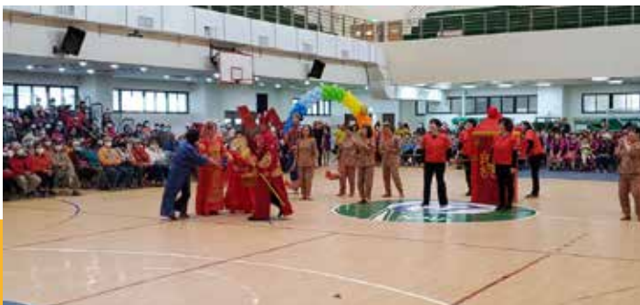
◀ 湖西鄉菓葉社區歌舞劇表演