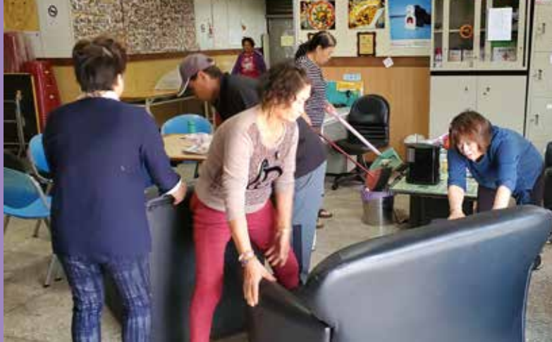
圖/龍門社區志工們共同合力維護社區活動中心環境整潔

寶圓志工詼諧的敘說，龍門社區的一群志工，整天吵吵鬧鬧，外頭的人第一次來到社區，總會認為他們兇悍的在吵架，其實是龍門社區志工所具有純樸性格，深感自豪；也因如此，在107年成立的社區關懷據點暨C級巷弄長照站，志工們共同的協力合作，展現活力與主動性，不辭辛勞的進行家庭訪視、親切的電話問安、用心的準備供餐料理、耐心的陪伴長者在活動中心進行健康促進活動等，每日都有40-50不等的長者參與社會活動。不過，目前龍門社區65歲長者為293人，他們期望發揮居住在社區各鄰的志工可近性，再鼓勵社區潛在的長者走出家中，強化身心健康，延緩老化。