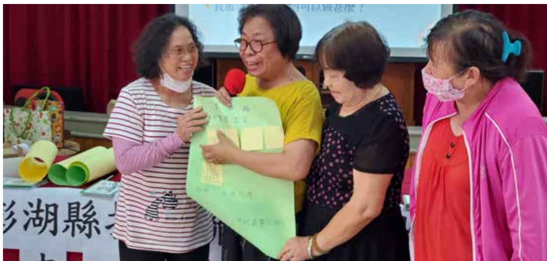
圖/馬公市東衛社區藉由辦理志工成長訓練，激發社區民眾對社區服務的行動構想

參與是社區營造的核心，但並不是所有社區居民都有時間來參與，此時沒有參與的人，一樣可以對社區營造工作造成影響。因為社區營造工作需要被鼓勵、被支持，才能長期的持續下去。雖然參與是最好的鼓勵與支持，但沒辦法參與的情況下，只要我們不要冷眼旁觀，或者冷諷熱潮，而是抱持正面讚賞的態度，同樣可以讓參與者感到溫暖，並提升社造的氣氛，如此對社區營造一樣是有貢獻的。