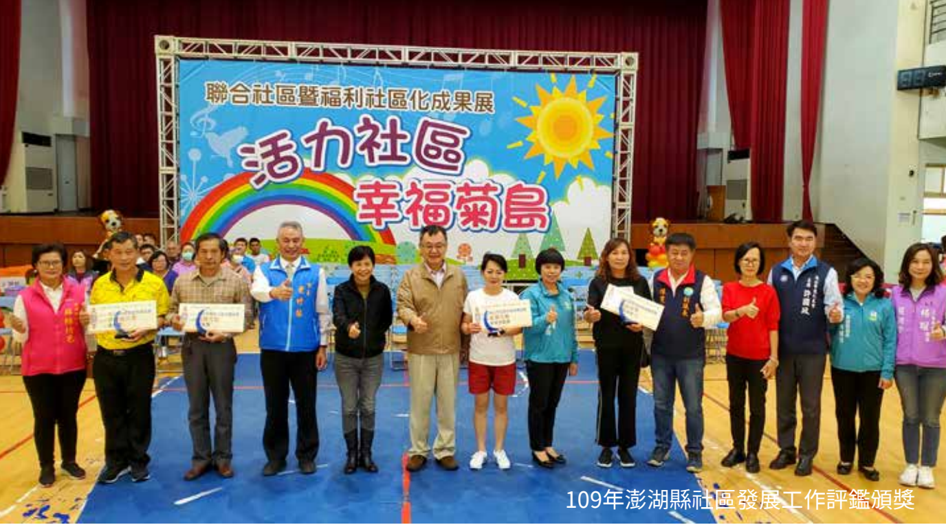
109年澎湖縣社區發展工作評鑑頒獎