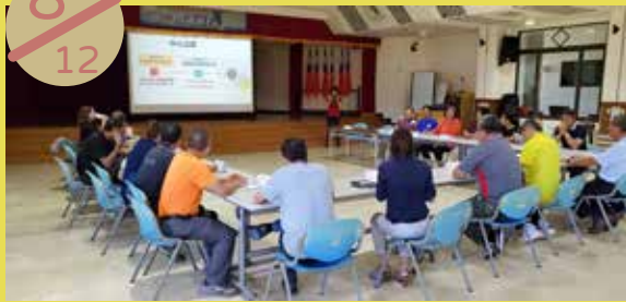
湖西鄉社區聯繫會報