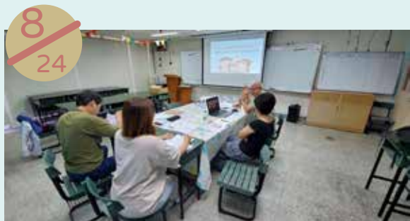
中心團隊： 「社福考核指標及現況執行工作內容」