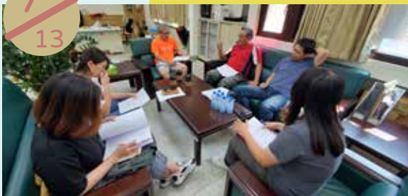
澎湖縣社區再造培力中心團隊 與縣府進行第三次會議