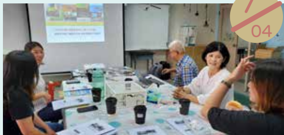
中心團隊：「社區培力輔導之作為」外督