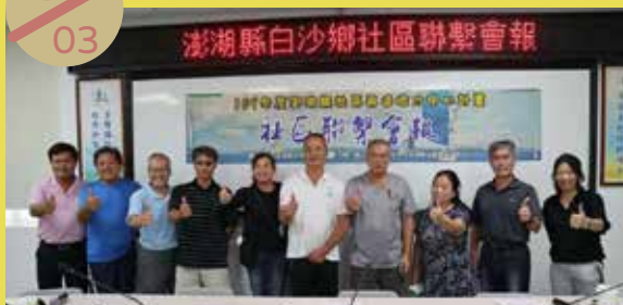
白沙鄉社區聯繫會報