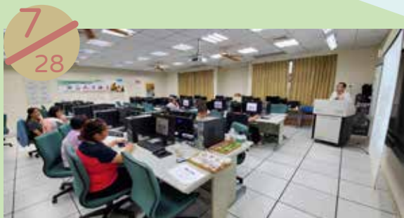
澎湖縣社區再造培力中心 辦理課程：社區資訊服務網站操作