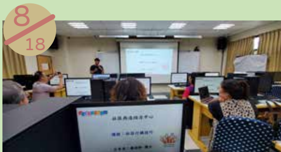
澎湖縣社區再造培力中心 辦理課程：社區行銷技巧