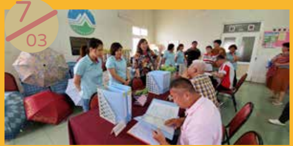
白沙鄉中屯社區參加澎湖縣社區評鑑