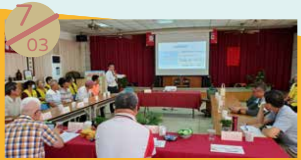
馬公市東衛社區參加澎湖縣社區評鑑