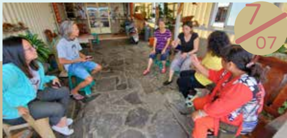
▲ 聯合社區計畫：小門社區輔導