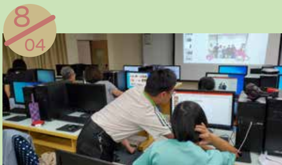
澎湖縣社區再造培力中心 辦理課程：多媒體動畫製作