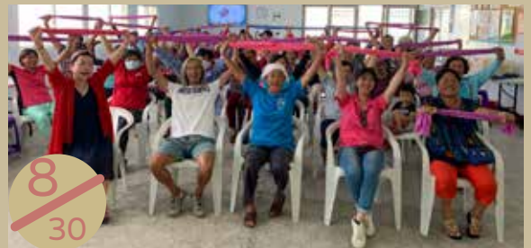
▲ 聯合社區計畫：西嶼鄉橫礁社區辦理老人福利方案—健康律動