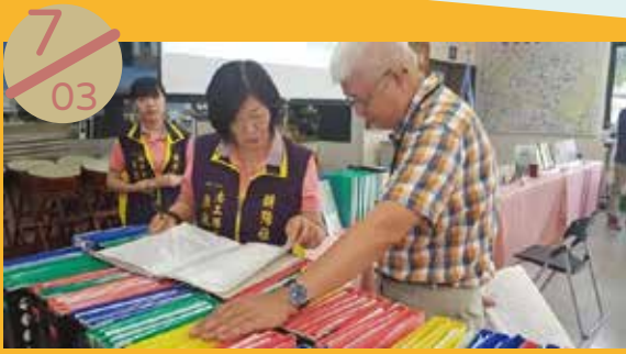
馬公市朝陽社區參加澎湖縣社區評鑑