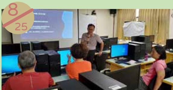
澎湖縣社區再造培力中心 辦理課程：網路應用程式安全漏洞介紹與防護