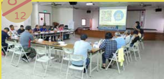
馬公市社區聯繫會報