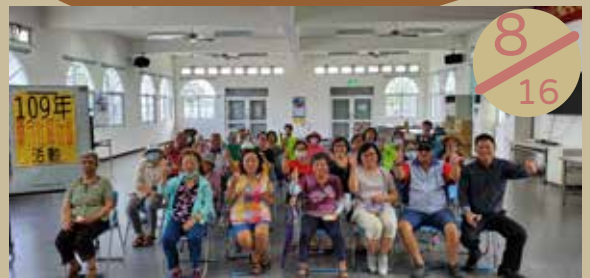
▲ 聯合社區計畫：馬公市前寮社區辦理老人福利—傳統美食製作活動