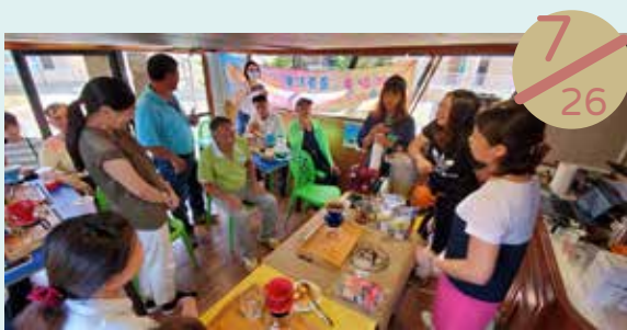
湖西鄉社區福利化旗艦計畫— 生活咖啡美學