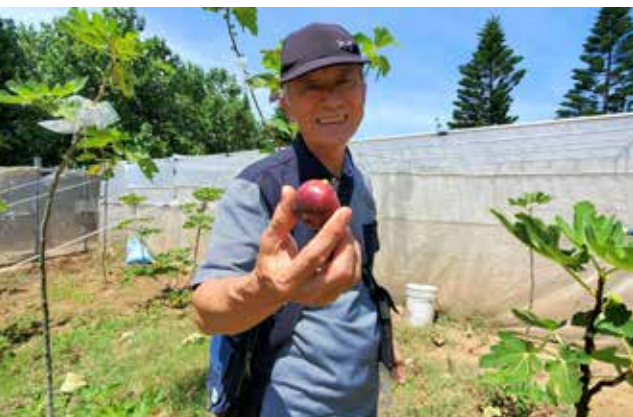
▲ 社區志工，地盡其利，打造志工農場，添增除草兼吃果的樂趣