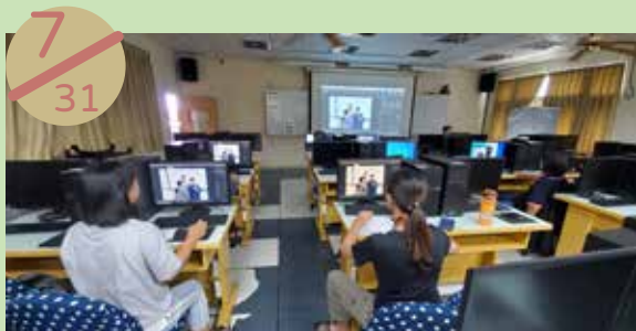
澎湖縣社區再造培力中心 辦理課程：多媒體圖形製作