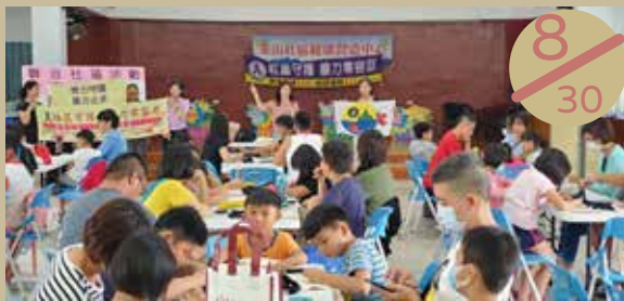
▲ 聯合社區計畫：馬公市案山社區辦理兒童及青少年方案—側包彩繪親子活動