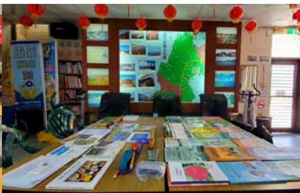
▲ 仁和總幹事發揮自身教育工作者的專業主動積極進行社區調查竹灣