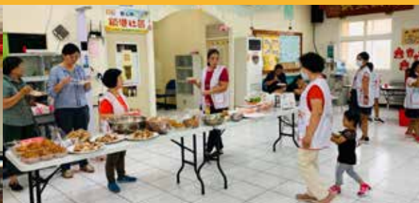
台灣夢兒少社區陪伴扎根計畫鎖港基地成果