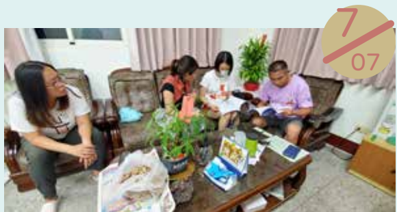
中心團隊進行 湖西鄉福利化社區旗艦計畫輔導工作