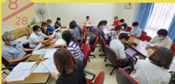
澎湖縣社區再造培力中心 跨部會聯繫會報