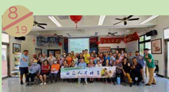
澎湖縣社區再造培力中心 辦理名人社區公益活動