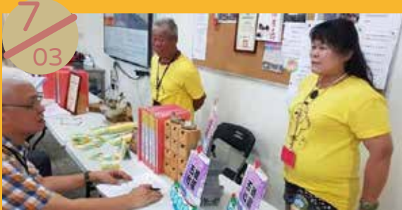
馬公市五德社區參加澎湖縣社區評鑑