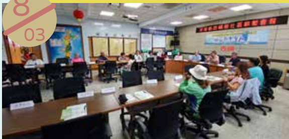
西嶼鄉社區聯繫會報