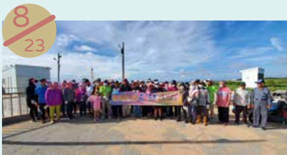
湖西鄉社區福利化旗艦計畫— 林投沙灘清理計畫