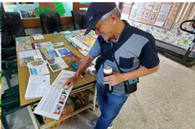
▲ 社區成立美食研習班，志工討論製作適合長者餐食