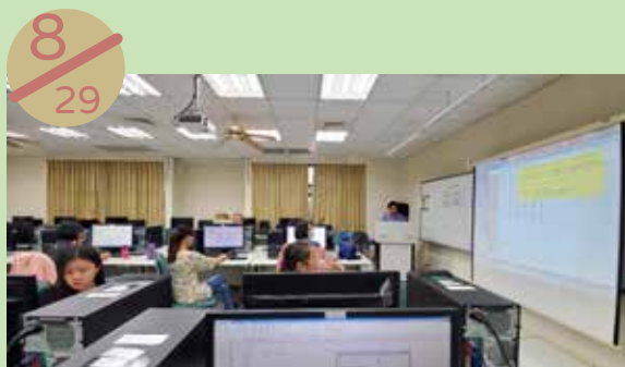
澎湖縣社區再造培力中心 辦理課程：社區成果整理技巧與實務應用