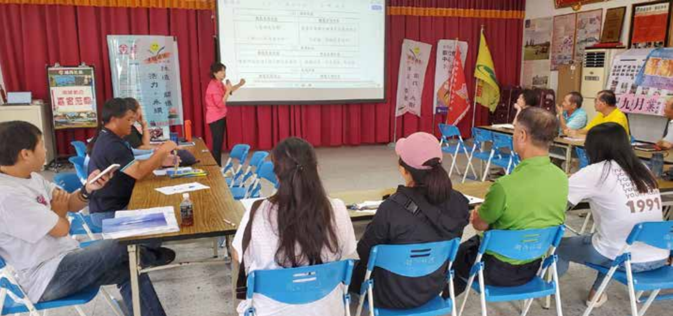
▲ 湖西社區大旗艦計畫參與社區思考社區特性，訂定營造策略討論會