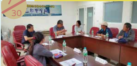
七美鄉社區聯繫會報