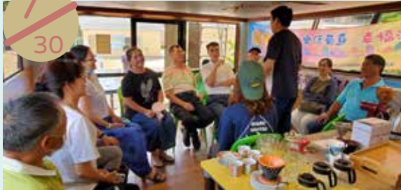
湖西鄉社區福利化旗艦計畫— 聯合社區理念與做法課程