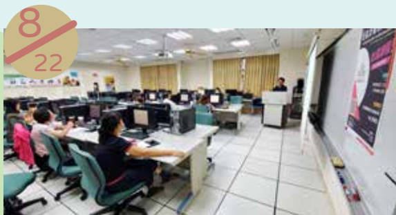
澎湖縣社區再造培力中心 辦理課程：社區計畫核銷實務